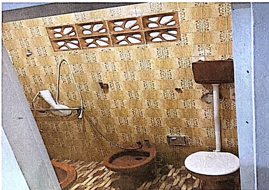
Banheiro do interior da residência.