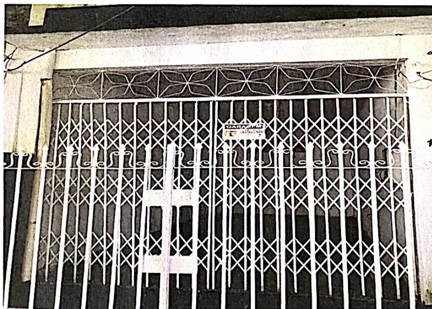
Garagem e entrada da residência.