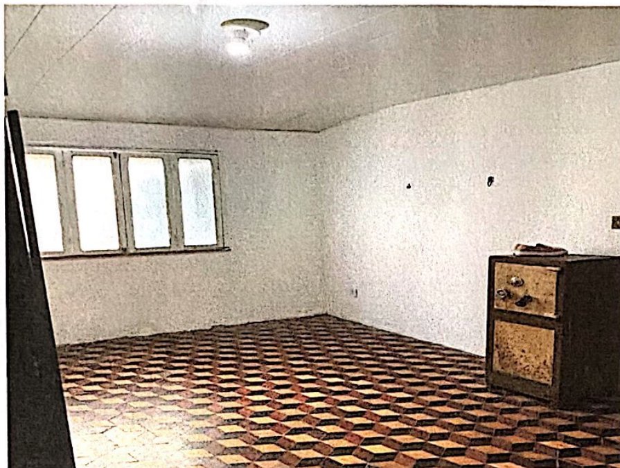
Quarto da residência.

DE MÃOS DADAS PARA O FUTURO CNPJ Nº 22.938.757/0001-63