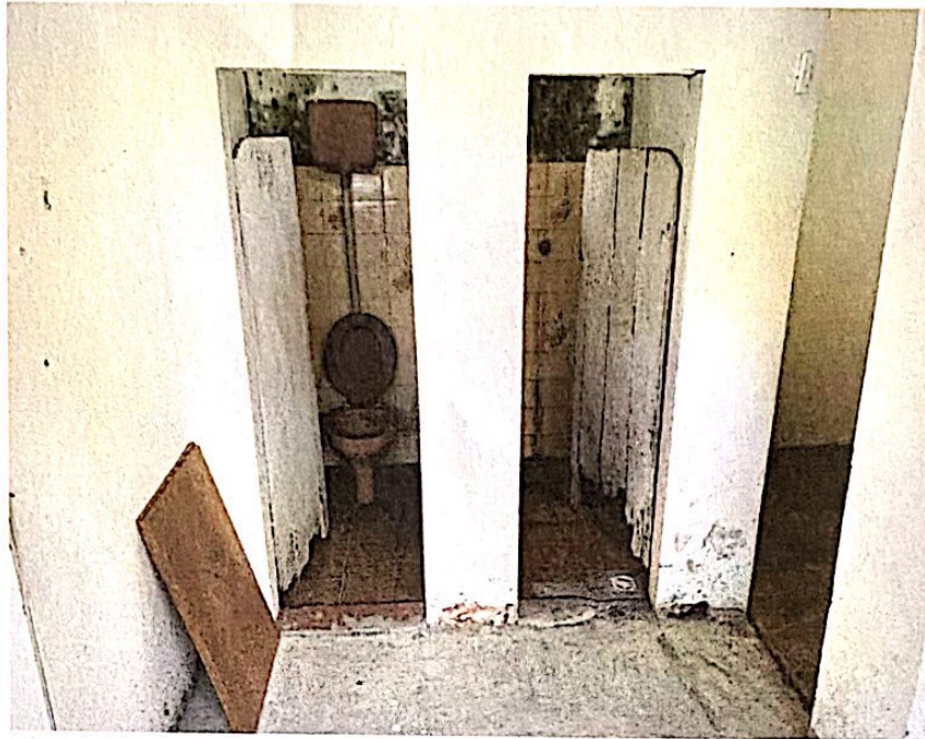
Banheiro exterior da residência.