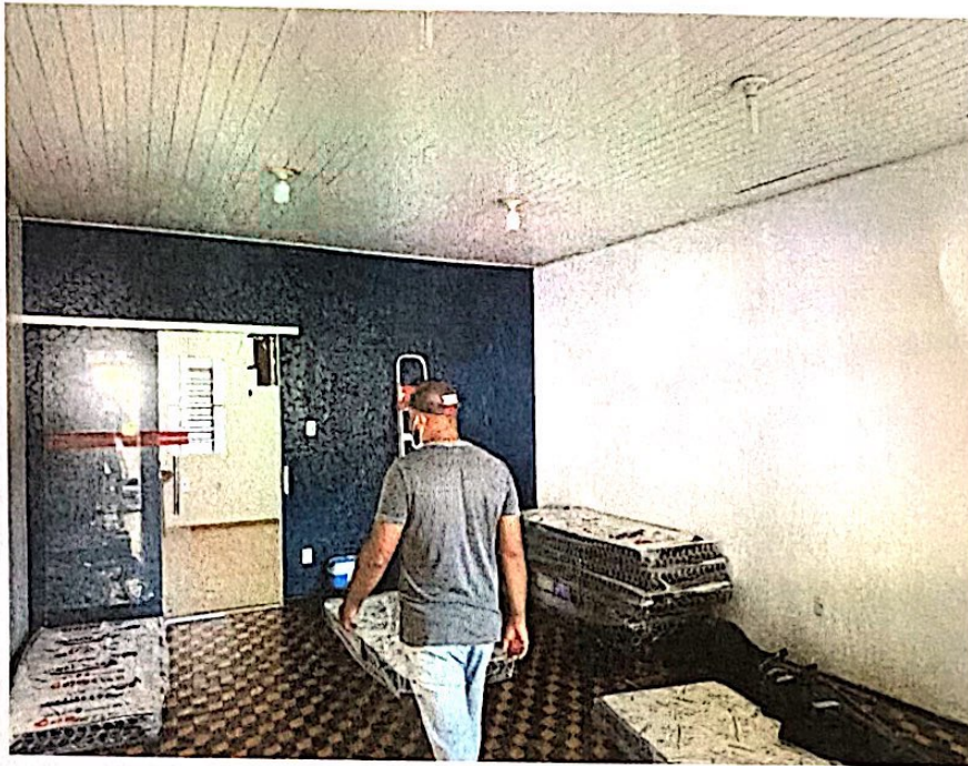
Sala de entrada.