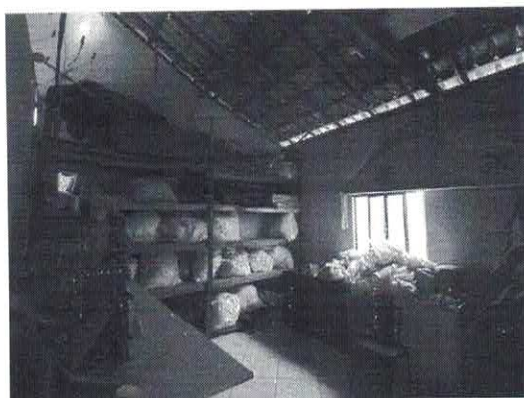
Depósito nos fundos