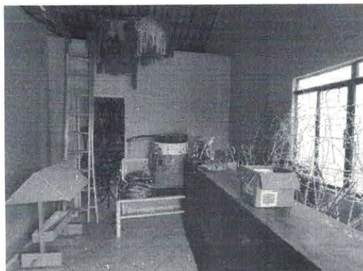
Depósito nos fundos