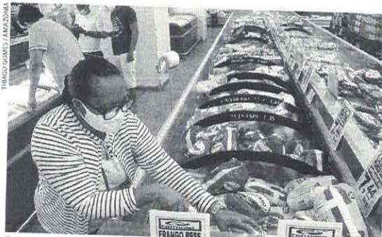
Nos dois primeiros meses de 2021, preço do frango já subiu 7,53%

COMO NORMALMENTE OCORRE COM PRODUTOS ALIMENTÍCIOS, PREÇO PRATICADO SUPERA A INFLAÇÃO