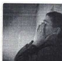
Aprendendo com a dor