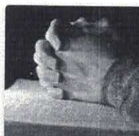
Orar em ritmo pascal