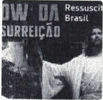
Em 01/04 - Show da Ressurreição - Ressuscita Brasi